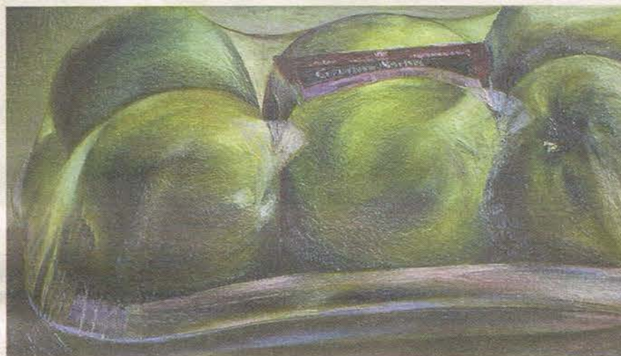
Foto links: 'To Smoke', 2005; foto boven: 'Potatoe Toes', 2002; foto onder: 'Granny Smiths', 2004.