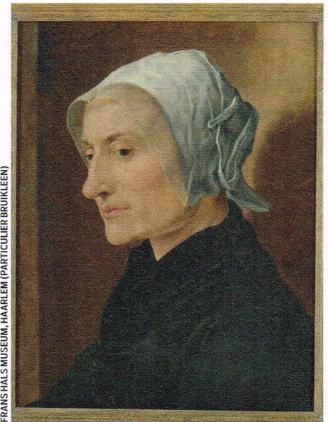
FRANS HALS MUSEUM, HAARLEM (PARTICULIER BRUKLEEN)