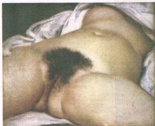
Gustave Courbet: L'Origine du monde. 1866.

Geslachtsdelen zijn net zo verschillend als gezichten. Dat maakt ze heel geschikt als onderwerp voor een getekend of geschilderd portret. Toch kost het sommige museumbezoekers moeite om zonder ongemak naar zulke kunstwerken te kijken.