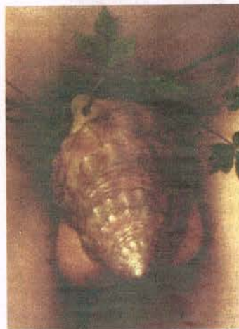
Jan Gossaert, detail uit Neptunus en Amphitrite , 1516. Gemäldegalerie, Berlijn.

Andy Warhol maakte in de jaren zeventig een tijdlang polaroids van de piemels van bezoekers van zijn Factory in New York. De Nederlander Arnoud Holleman liet zich daar misschien door inspireren toen hij in 2002 tekeningen maakte van de penissen van zeven vrienden. Potloodventers in potlood op papier. Alleen al in die zeven tekeningen is de verscheidenheid enorm: er